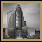
英格列斯百货 西班牙马德里